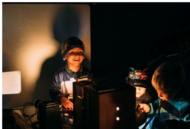
WS Scénická technologie pro produkční