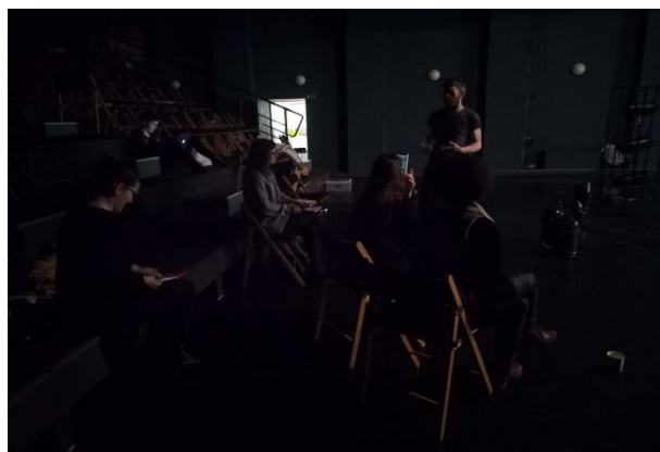
WS Scénická technologie pro produkční