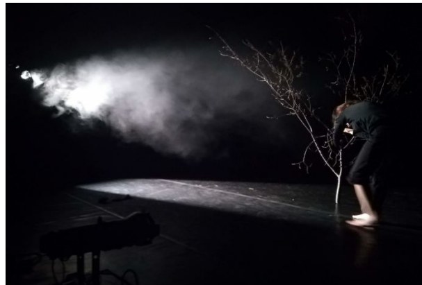
WS Základy světelného designu I